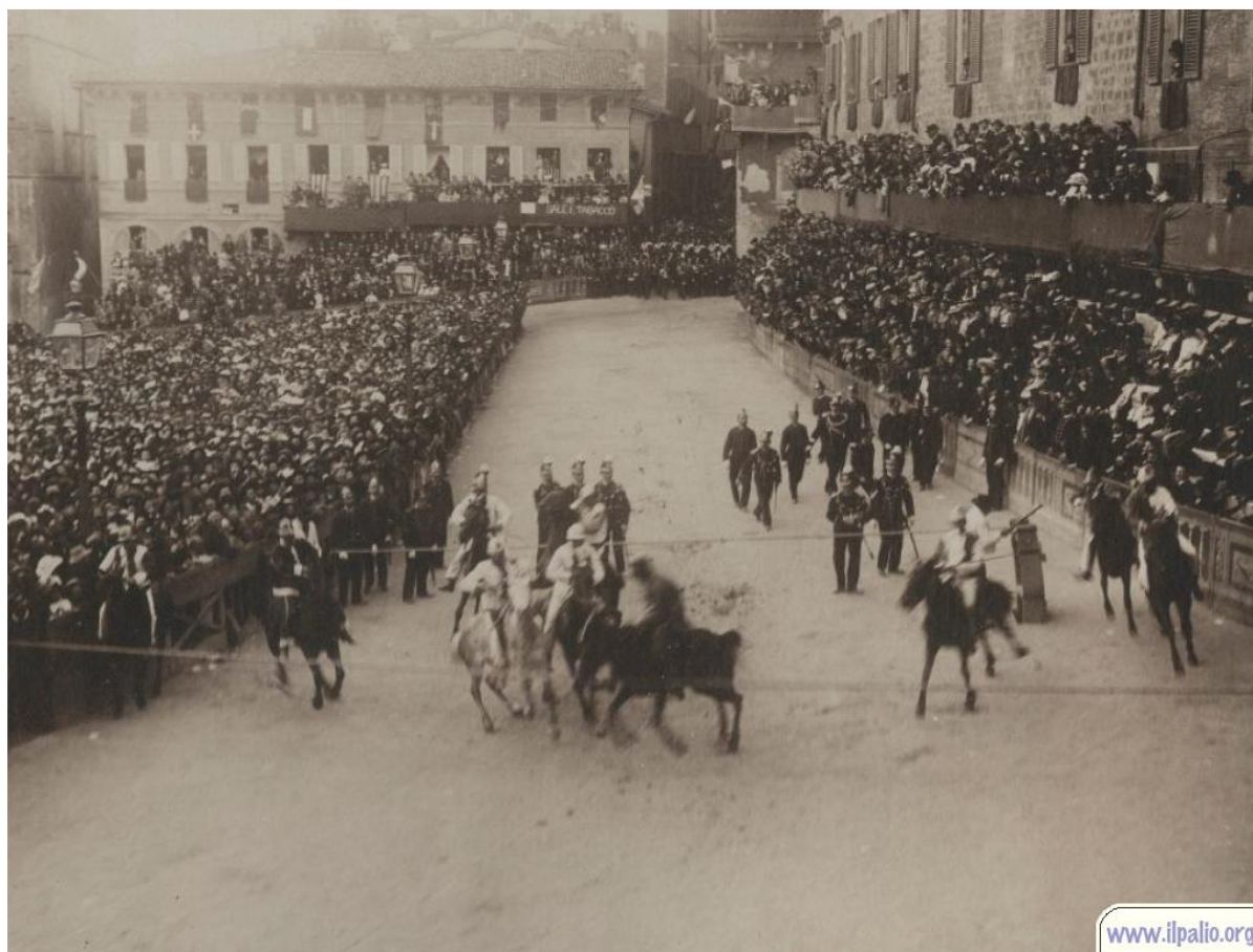
Palio del 17 aprile 1904 vinto dal Leocorno con Picino

Questo l'allineamento alla Mossa: Giraffa con Pallino, Civetta con Testina, Lupa con Zaraballe, Valdimontone con Scansino II, Oca con Spanziano, Onda con Tabarre, Aquila con Nappa, Pantera con Martellino II, Leocorno con Picino, Istrice con Popo.